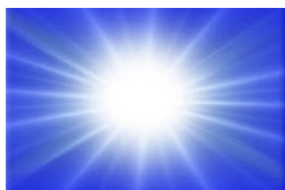
IMAGEM PARECIDA COM UM PORTAL PARA OUTROS MUNDOS:

Existem portais que levam para outros mundos, esses portais são uma luz pequena que brilha e quando você encosta nela ela pode ser muito fria ou quente e ela pode te levar para outros mundos como o das fadas, não aconselho você a colocar a mão num portal desses por que eles se fecham muito rápido e você pode ficar preso naquele mundo para sempre ou até você encontrar o portal que leve para o plano astral de volta. O mundo éterico é um mundo muito diferente dos outros lá tem deuses que são gerados pela nossa fé, para que um deus exista ou um lugar muitas pessoas tem que acreditar que ele existe quando digo muitas pessoas é milhões vamos dizer que existe um determinado lugar onde eu e mais um milhão de pessoas acredite que ele exista esse lugar irá existir.